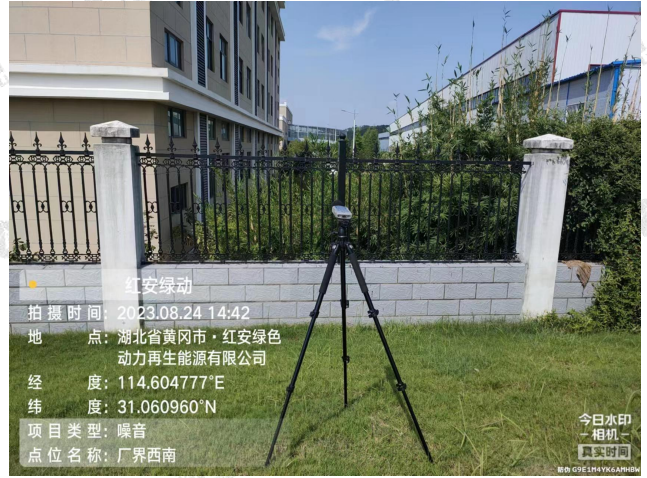
▲厂界噪声采样点 - 厂界西南外 1 米处 2#