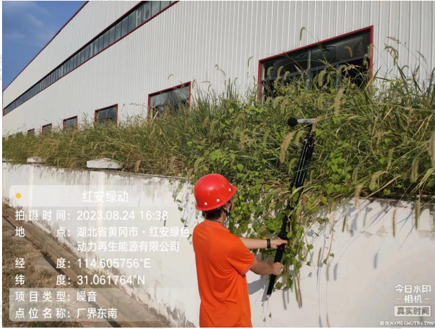
▲厂界噪声采样点 - 厂界东南外 1 米处 1#