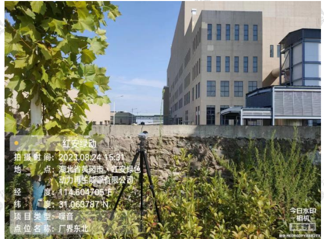
▲厂界噪声采样点 - 厂界东北外 1 米处 4#