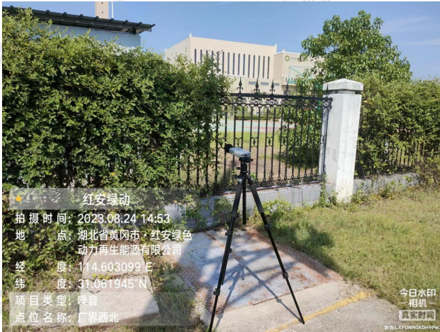
▲厂界噪声采样点 - 厂界西北外 1 米处 3#