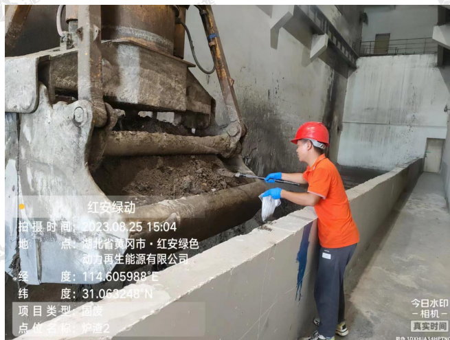
■ 固体废物采样点 - 2#炉炉渣