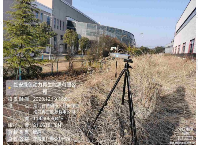
▲厂界噪声采样点 - 东南侧厂界外 1m 2#