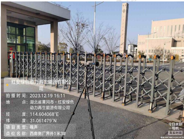
▲厂界噪声采样点 - 西南侧厂界外 1m 3#