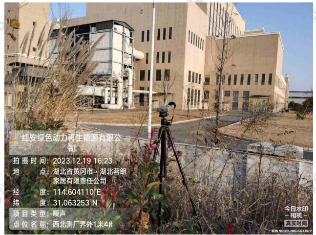
▲厂界噪声采样点 - 西北侧厂界外 1m 4#