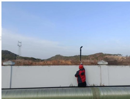
▲厂界噪声采样点 - 厂界北侧外 1m 处 4#