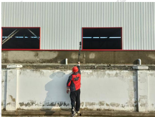
▲厂界噪声采样点 - 厂界东侧外 1m 处 1#