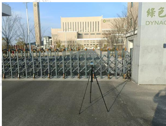
▲厂界噪声采样点 - 厂界南侧外 1m 处 2#