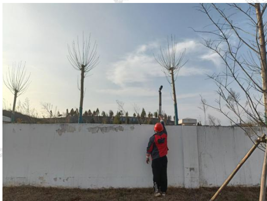
▲厂界噪声采样点 - 厂界西侧外 1m 处 3#