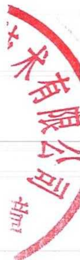
附表：质量控制及质量保证措施